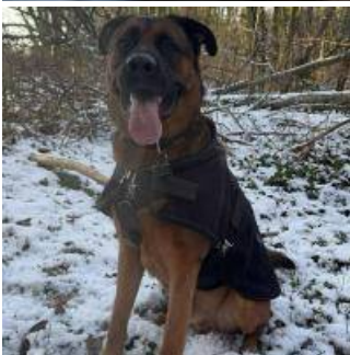
Bagheera 8 ans