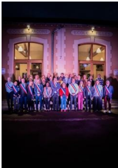
Les adjoints et adjointes au Maire

Au casting, treize adjoints au maire, sept conseillers municipaux délégués, huit conseillers municipaux et six élus d'opposition. Nous vous les présentons dès maintenant !