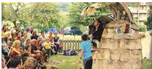
La Tente d'Edgar