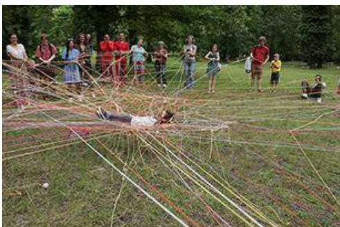
Tisser des liens

Compagnie Lunatic 40 minutes | Tout public dès le plus jeune âge Direction artistique Cécile Mont-Reynaud