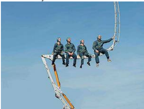
Théâtre de rue volant et antigravitationnel