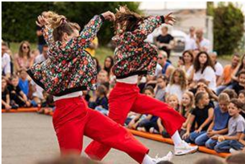
Compagnie Lève un peu les bras