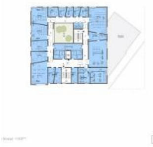
Futur conservatoire municipal