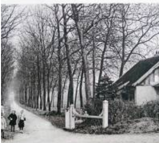
9358 (s.-et-M.) - Domaine de Morfondé - Balcon de rétro-ville - L'Entrée